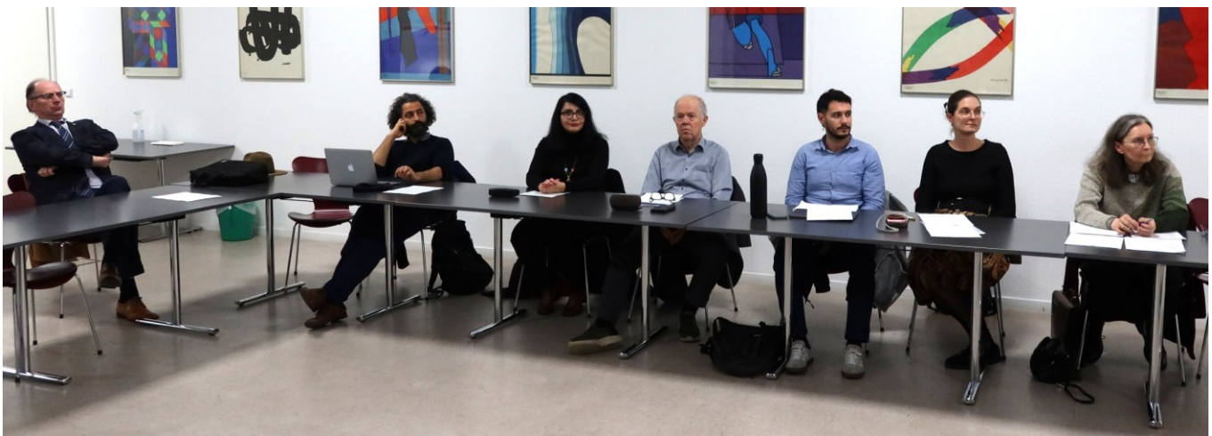
Une partie de la salle durant le séminaire

Commentaire : On peut avoir l'impression que la planification et la mise en oeuvre de certains grands projets d'infrastructure du « Global Gateway » en Afrique nécessitent un temps allongé, alors que la Chine semble avancer à grands pas dans ses projets de la « Belt and Road Initiative » (Initiative route et ceinture, la nouvelle route de la soie).