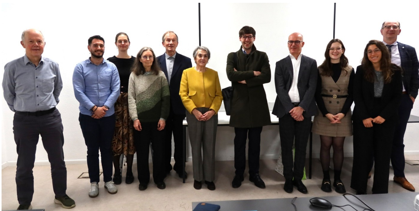
Participants au séminaire

Commentaire : Au niveau de l'inclusion, la digitalisation devrait être prise en considération ensemble avec les autres moyens de communication oraux et visuels. Il peut s'avérer difficile de distinguer ce qui a été généré par les hommes et par l'intelligence artificielle.