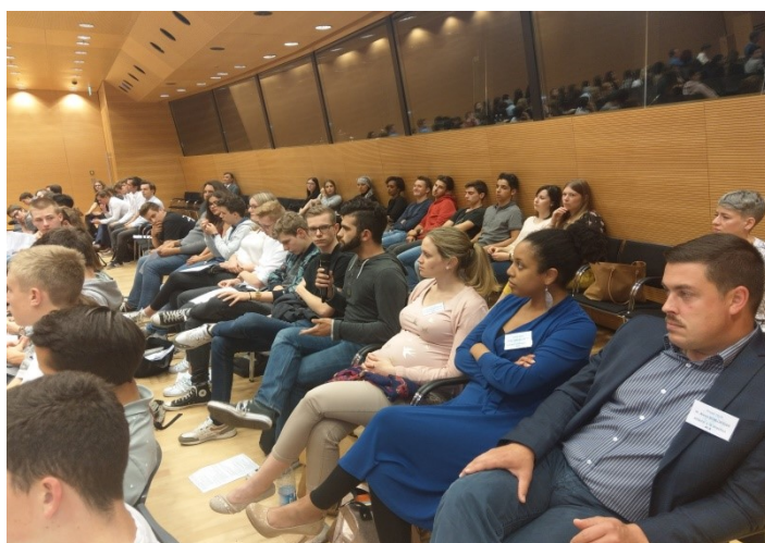
Journée du 15 mai - Séquence de questions/réponses

En page suivante figure un tableau synthétisant les points clés soulevés pendant les sessions finales du projet