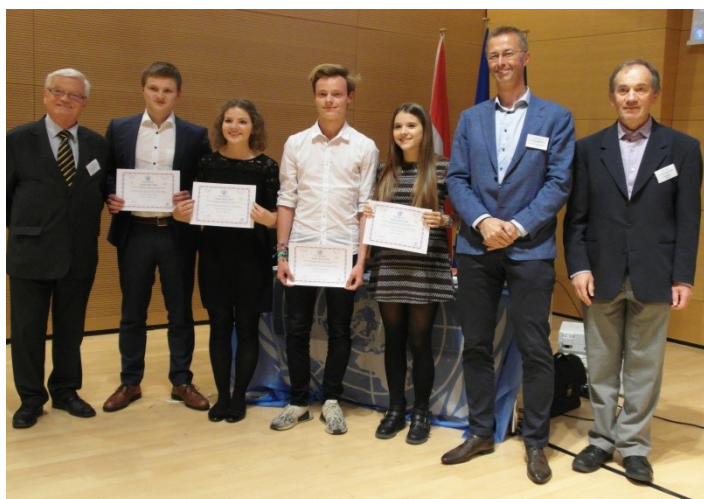
Athénée de Luxembourg – Groupe 2 : Premier prix du concours